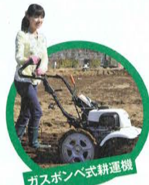
ガスボンベ式耕運機