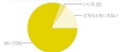
Q. 太陽光発電を設置したことにより節電意識は高まりましたか?

最後に、「太陽光発電を設置したことにより節電意識は高まりましたか?」という質問をした。結果、80.6%が「はい」、「いいえ」が3.8%、「どちらともいえない」が15.6%と解答した。太陽光発電システムを設置すると、節電意識も自然と高まるという結果となった。